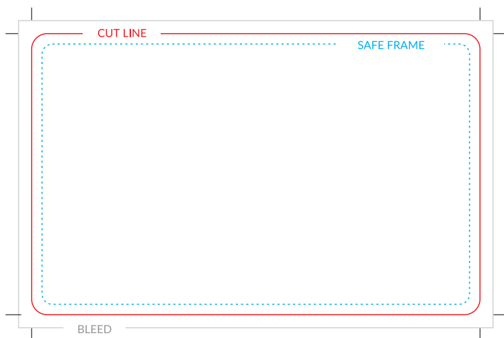
SKU NT1 / NT2